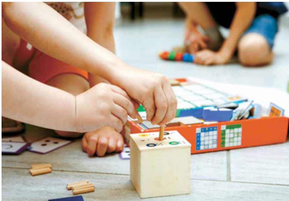
La Educación inclusiva reconoce el derecho a la Educación de todos los niños sin distinción.

Mientras, en Lalín (Pontevedra) se vivía una situación similar. Tras alguna pelea entre el menor con necesidades especiales y otros niños, el colegio explicó a la familia en cuestión que quizá debía cambiara su a un centro de atención especial en Vigo, por si el niño iba a peor. En teoría, era únicamente una sugerencia opcional que acabó siendo una exigencia por parte de los padres de otros alumnos, que pusieron a sus hijos en huelga durante dos días para forzar al centro a tomar esta decisión.